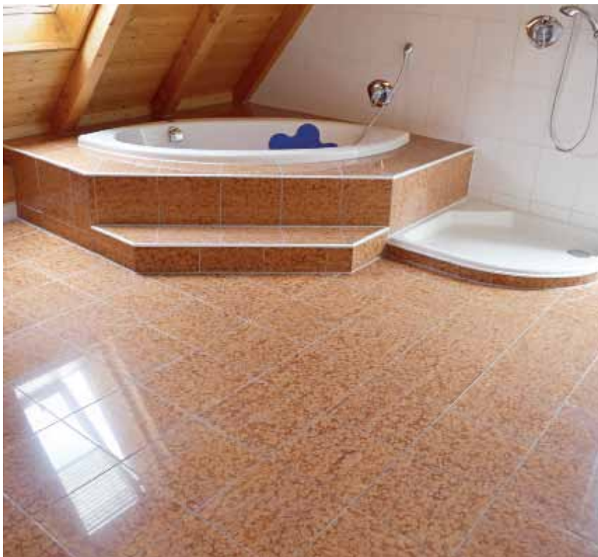
Nach Abschluss der Arbeiten ist der Natursteinbelag »wie neu«.

einen Veroneser Kalkstein: Pietra della Lessinia. Die Doppelsynagoge besteht aus zwei fast identischen Räumen. Aus einem rechteckigen Sockel von 22 auf 29 Metern in strenger Symmetrie »wachsen« zwei würfelförmige Räume von je 10,5 Metern Kantenlänge himmelwärts zu Zylindern von 15 Metern Durchmesser.