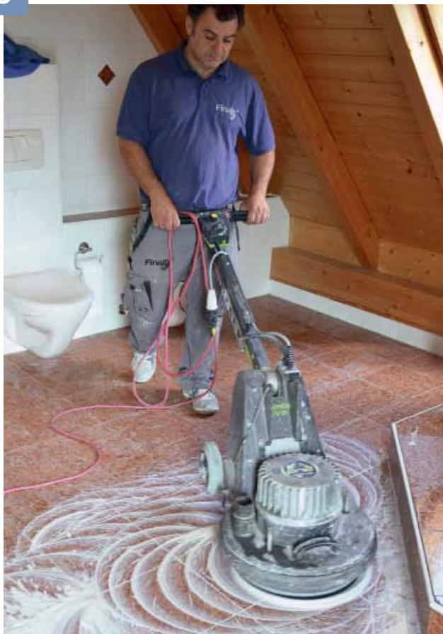
Das Polierpulver wird mit einer Einscheibenmaschine im Nassschleifverfahren verarbeitet.