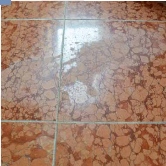
Säurehaltiger Haushaltsreiniger zerstört die Oberfläche von Kalkstein.