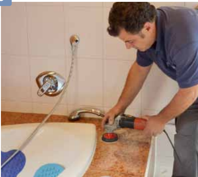
Kleine Flächen erfordern die manuelle Bearbeitung mit Handmaschinen.