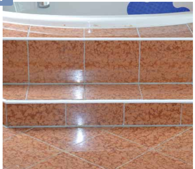
Fliesenschienen müssen während der Arbeiten vor Beschädigung geschützt werden.