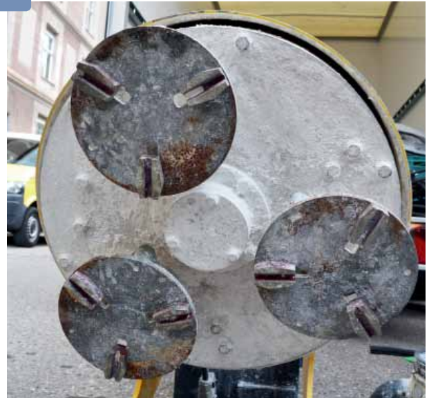
Schleifteller für den Planschliff im Diamant-Nassschleifverfahren

In diesem Badezimmer war der Belag aus 30 x 30 Zentimeter großen Platten Rosso Verona durch eine versehentlich umgestoßene Flasche Kalklöser stellenweise stark beschädigt: Die Säure war von der Wanneneinfassung über die Stufen auf den Boden gelaufen und hatte den Kalkstein angegriffen und aufgeraut 1 . Die Oberfläche des Steins hatte ihren Glanz verloren.