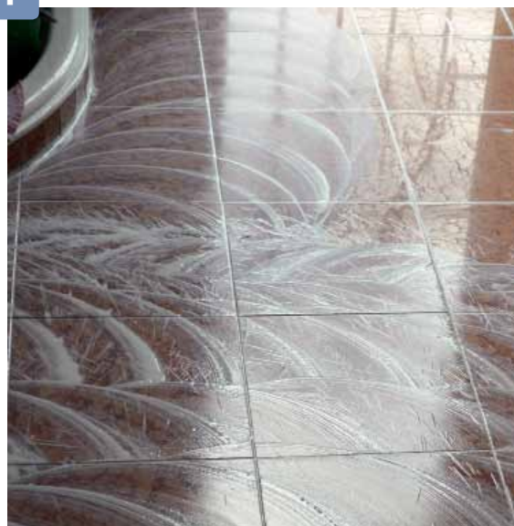
Die Verarbeitung im Nassschliff beugt Verbrennungen des Steins vor.